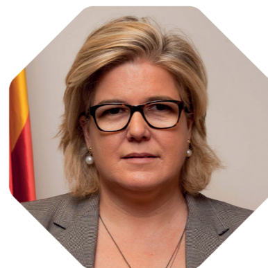
Meritxell Masó Secretària d’Administració i Funció Pública

“Una administració de les persones per a les persones necessita directius públics preparats per excel·lir en la seva tasca de servei a la ciutadania.”